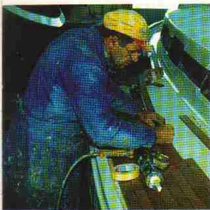
Feine Holzarbeit basiert auf teurer Handwerkerfähigkeit.

Doch was würden alle Ideen und all das Planen nutzen, ge-